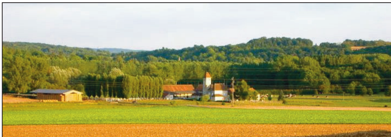
La ferme de Launay à Nesles-la-Vallée

Il nous faut plus que jamais être vigilant sur la qualité de nos sites et paysages car rien n'est définitivement acquis : la même circulaire demandait également de faire un signalement des principaux sites inscrits, dégradés au fil des décennies et ne méritant plus cette protection et pour lesquels une radiation de l'inscription, partielle ou totale, était à mettre en œuvre, conformément aux orientations de la circulaire du 11 mai 2007 relative à l'évolution de la politique des sites inscrits. La commission a ainsi voté une radiation partielle ou totale de cinq sites anciennement inscrits !