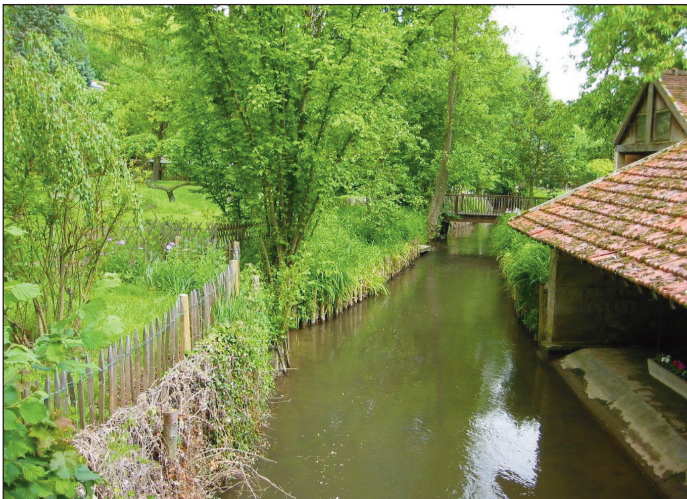
Le Sausseron à Vallangoujard

Nous ne sommes qu'au début d'un projet qui doit être entériné par le ministère et la préfecture après avis favorable des communes concernées.